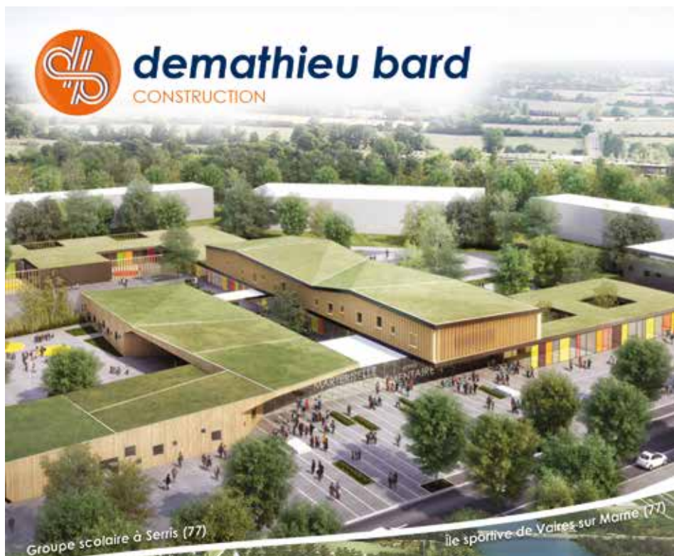
Groupe scolaire à Serris (77)