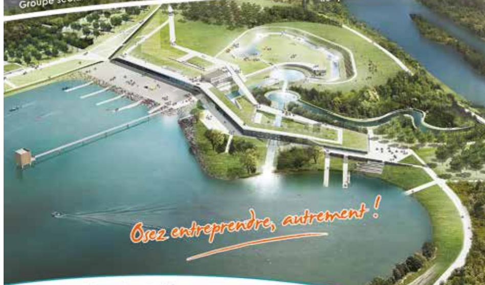
Île sportive de Vaires-sur-Marne (77)